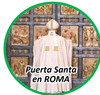
Puerta Santa en ROMA